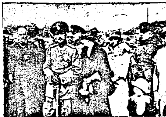
Leurs Majestés Le Roi et la Reine.

Отпразнуването във Варна Българската Независимост и 15 г. отъ Възшедственото на Н. В. Царя