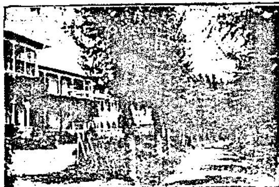
Една отъ алеитѣ въ санаториума. Une allée de Sanatorium.