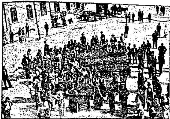
Гроздоберъ — Le Vandange

Отпразнуването във Варна Българската Независимост и 15 г. отъ Възшедственото на Н. В. Царя