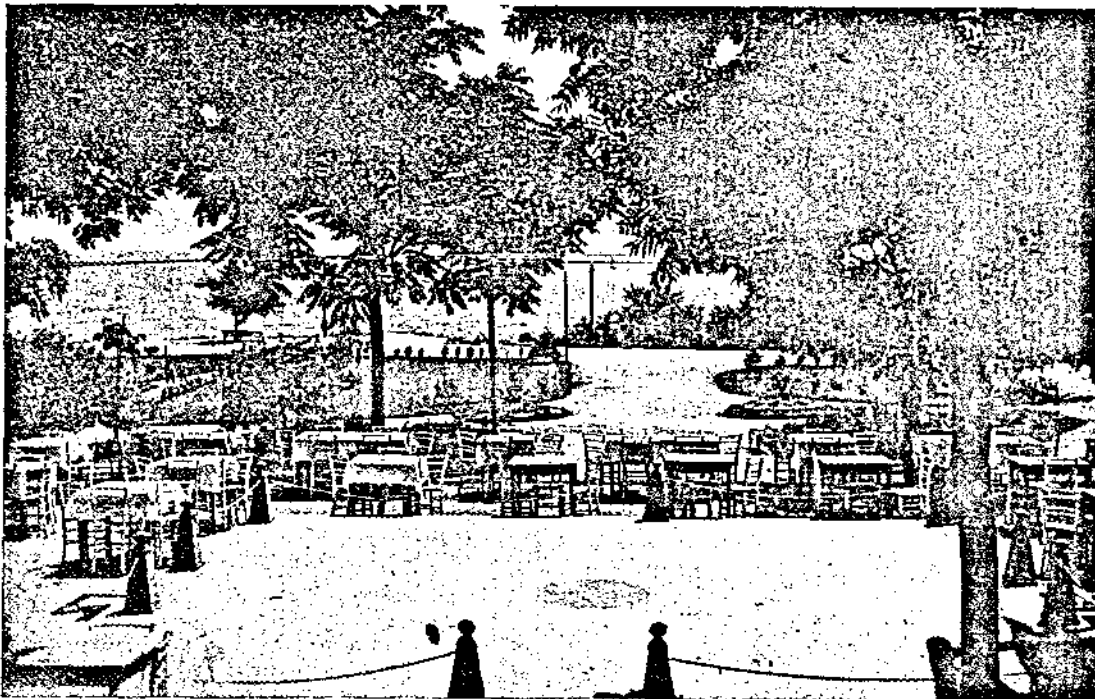
Дансинга и терасата предъ бюфета на манастира „Св. Константинъ“ — обявенъ за гроздолъчевна станция. Le dancing et la terrasse du buffet au monastère St. Constantin — station balneaire et de cure de raisin.