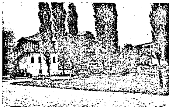
Една отъ вилите на курорта „Св. Константинъ“

Не трѣбва само да се разправя за хубавия плажъ, баните и морската градина, а да се опише и хубавата околностъ. Началото на пропагандата да почва още отъ месецъ февруарий и продължава до априлъ. Тогава хората си решаватъ къде да прекаратъ своя курортъ. На читателите чужденци да се внуши, че идватъ въ единъ новъ за тяхъ свѣтъ, но не чуждъ. Трѣбва да имъ кажете, че България е сжщо културна страна и че въ ми-