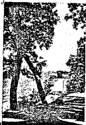
Алия по крайбрѣжието при Карантината.