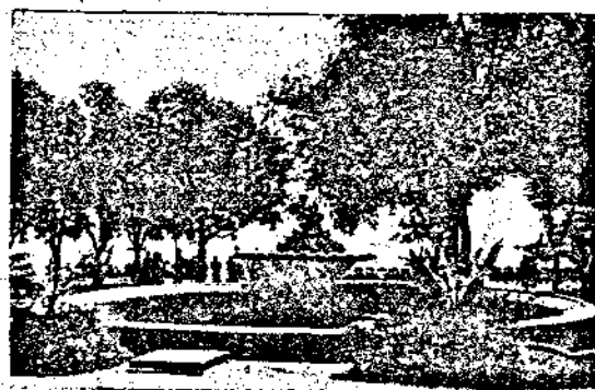
Художественъ фонтанъ въ Морската градина