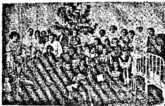
Коледна елха за децата съ подаръци отъ Н. Е. Царицата