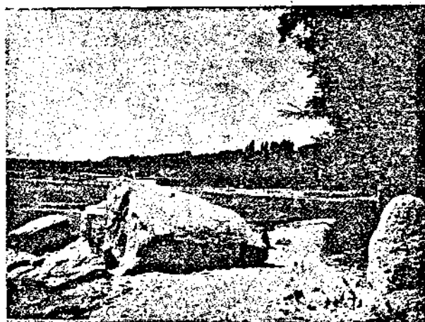
И природата е щедро украсила Варненския брѣгъ.

да бжде придружена отъ едно и повече кучета, много отъ които примамени отъ градскитѣ съблани около месарницитѣ, отричатъ се отъ селото и оставатъ да се скитатъ изъ града като безстопански кучета. А тъкмо тѣ сж най-опаснитѣ разносители на бѣса, та трѣбва безпощадно да се избиватъ. Изобщо службата по тровене на безстопанствени кучета трѣбва да бжде постоянна, всекидневна, презъ течение на цѣлата година. Къмъ края на зимата кучетата се събиратъ на глутници по десетина и повече — това е най-опасниятъ моментъ за разпространение на бѣса и най-удобния за масово тровене.