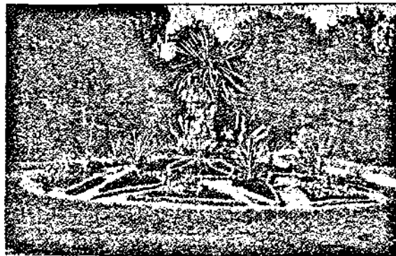
Китче отъ Морската градина.

будително, а топлиятъ успокоително действие върху организма. Чрезъ масажирание на тѣлото, следъ една студена баня може чувството на студъ да изчезне и по този начинъ организма се калява.