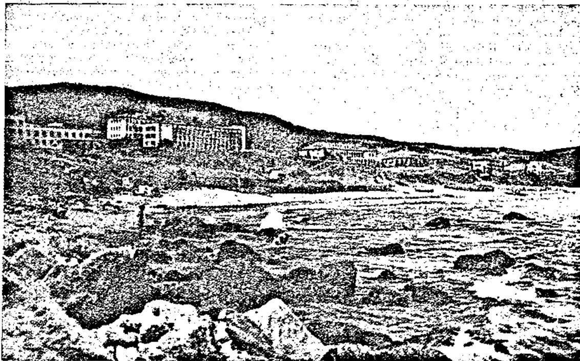
По крайбрежието на Варна непрестанно се издигат хубави дворци — почивни станции за хиляди лъговници.

вече съ сегашното му име Варна, е игралъ първостепенна роля. Още първото известие за Аспаруха отъ историка Теофана говори, че той „като преминалъ Дунава стигналъ до Варна близо до Одесось“. Сжщото споменаватъ и Никифоръ и Кедринъ. Това ни показва, какво голъмо значение се е отдавало на варненската крепостъ вътре въ византийската империя. Съ завладяването на Варна Аспарухъ е принудилъ на отстъпки Византия, турилъ е основитѣ на новата държава. Може би въ сжщия акрополъ на Варна е билъ подписанъ историческиятъ договоръ, чрезъ който се потвърждава владението на дунавскитѣ земи отъ българитѣ — единственитѣ отъ голъмия потокъ на племена, които сж живѣли съ държавническа мисль, упорити, надарени съ издържливостъ и организационенъ духъ и свързани съ своя господарь не чрезъ връзкитѣ на насилието, но чрезъ мисльта за голъмата историческа задача, която имъ е била предопредѣлена отъ съдбата.