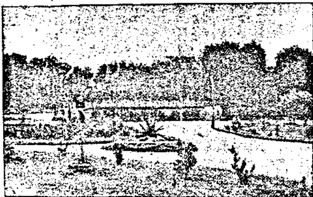
Алея въ Св. Константинъ.