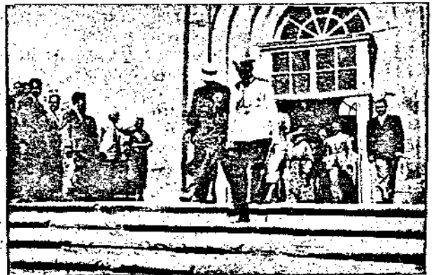
Т. В. Царьтъ и Царицата на излизане отъ Катедралната църква, където присѣтствуваха на молебена по случай първия именъ день на Н. Ц. Височество Князь Симеонъ Търновски.

Нека върваме, че отпразнуването на първиятъ рожденъ день на малкия князь въ стария Одесусъ ще донесе честити и щастливи дни за цѣлиятъ български народъ и отбележи неговото царуване като една отъ най-златнитъ епохи въ нашата история.