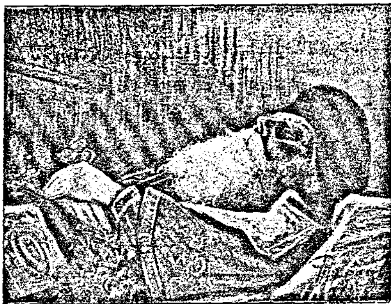
Дѣдо Симеонъ на смъртния одъръ въ Катедралната църква

свръхпрозорливостъ, въ гърдитъ на които, сякашъ тупти сърцето на цѣлия народъ — тѣй много сж отдадени тѣ на нашето, на българското. Тия израстнали и надарени синове на българската майка сж играли винаги една внушителна, по размѣри и значене, роля въ националния и културенъ възходъ на нашия народъ и държава.