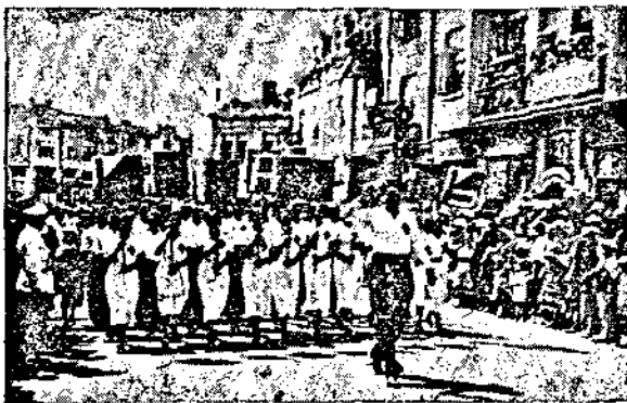
Манифестация отъ миналогодишния съборъ

Дошли сѣкшитъ съборяни отъ своитъ селищи въ голѣмия градъ, похвална е инициативата за създаването на малко развлѣчения и удоволствия на тѣхъ. По този начинъ тѣ ще иматъ още една незабравима представа и споменъ отъ Варна. И когато тѣ се завърнатъ по своитъ домове, въ сладъкъ споменъ презъ зимнитъ дълги нощи ще възпроизвеждатъ на ония, които не сѣ дошли красотата на тия феерични вечери, слѣта съ чаровната хубостъ на хилядитъ ракети и фонтани, свѣтлината, на които се кжпи въ водитъ на дивното Черно море.