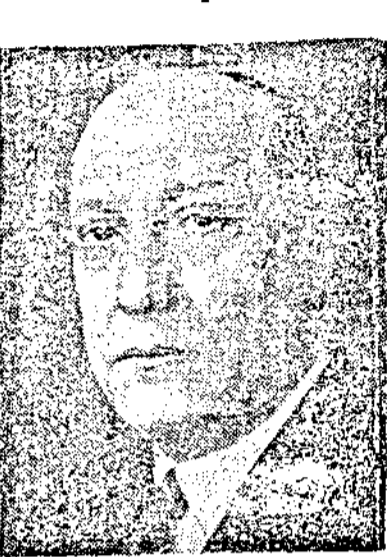
г. Цинцар Маркович

България, 25. (3 часа след полунощ) Мрът на външните работи г. Цинцар Маркович е дал на пр дставителя на агенция „Стефани“ следните изявления по случ й 3 годишнината от подписането на Българския пакт за приятелство и сътрудничество между