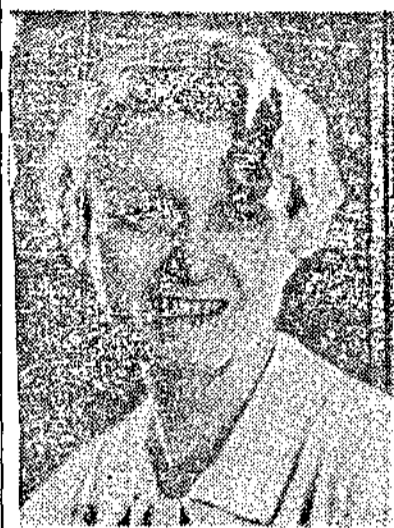
г-жа Табуи Париж, 24. Днешните парижки вестници коментират оживено промяната, станали в международното положение след срещата на Хитлер и Музолини в Бренер.

Между Берлин, Москва и Римъ било постигнато съгласие за образуването на тройния съюз. Въ Парижъ не вярват, че Италия ще се присъедини към оъта Берлин-Москва