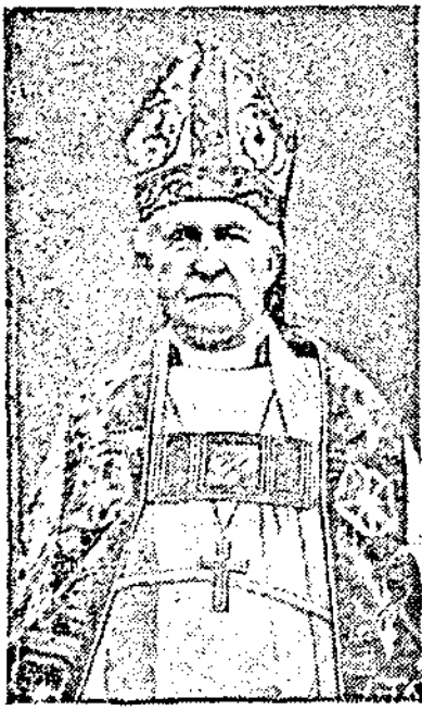
Кентърберийският архиепископ, който вчера произнесе молитвата в лондонската катедрала по случай „дъна на молитвата“ в Англия. Такива молитви били прочетени в всички английски църкви.