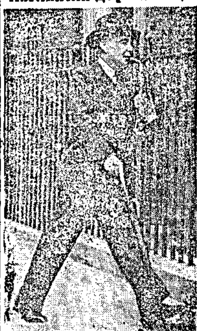
Хоръ Белиша който следъ подаване оставката си като министър на народната отбрана се отдаде на журналистическа работа. На снимката той се вижда, когато отива на работа.