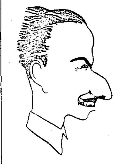
Съръ Освалдъ Мослей водачъ на английскитъ фашисти, който е арестуванъ отъ английскитъ власти следъ принаенето на новия законъ за народната отбрана.