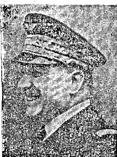
Генералъ Вийменъ Парижъ, 26. (Хавасъ) Ге керелъ Вийменъ, главнокоман дувашъ френскитъ въздушни сили, отправа къмъ войскитъ

къмъ френскитъ въздушни сили „Нашето небе трѣбва да остане френско“