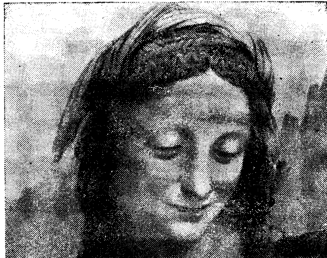
Леонардо да Винчи