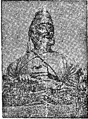
Паметникътъ въ Варна на легендарния добруджански революционер и националенъ българскитѣ герой — Стефанъ Караджа, който краси една отъ най-хубавитѣ улици на Варна — Царицата на Черно море.