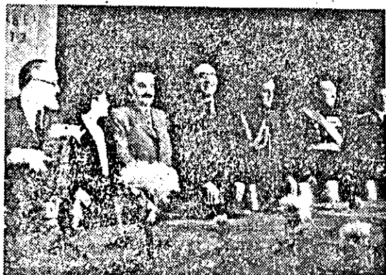
ПРЕЗИДИУМЪТ НА ТЪРЖЕСТВОТО В НАРОДНИЯ ТЕАТЪР

И действително, нетърпението и желанието на народа се отпразда: под нестихващите овации и викове: „Да говори другаря Димитров“, създателът на Отечествения фронт, произнесе своето първо слово.