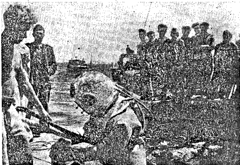
СПУЩАНЕ НА ВОДОЛАЗА

Начальник Штаба Краснознаменной, орденов Нахимова и Кутузова, Дунайской флотилии Капитан 1 ранга А. СВЕРДЛОВ.