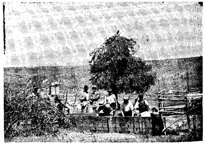
Ветеринарната служба въ Добруджа полага немалки усилия за борба съ крастата по овцетѣ.

Рекламата е душата на търговията и постига целта си само въ в. ДОБРУДЖАНСКИ ГЛАСЪ