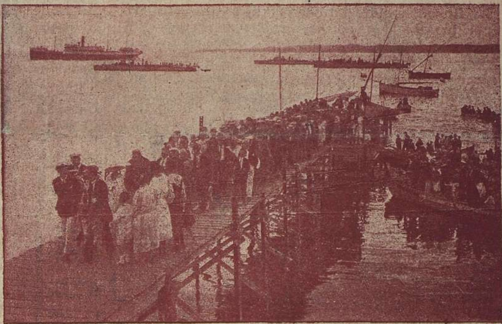
Царь Борисъ III, посрещнатъ най-тържествено въ Месемврия по случай обиколката си на Черноморското крайбрежие.

На открито море се виждатъ тритъ български миноносци, които сж го придружавали.