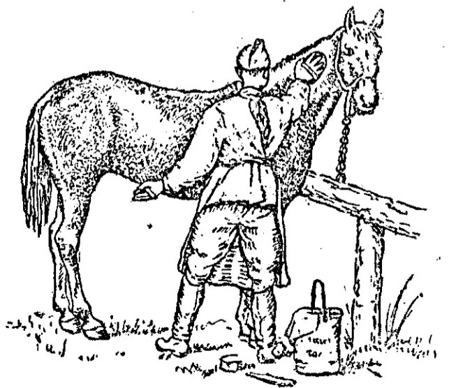
Правилна оборка на коня

лото — крака, копита и др. се измиват. Измитите части се изтриват с кърпа. При къпането и миснето на бременни кобили трябва особено много да се внимава.