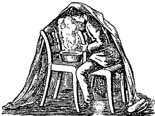
Парна баня на главата.