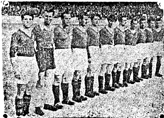
Футболния отбор на „Ботев“ ДНВ, който от 10 т. м. започна състезанията за първенство в националната дивизия.

6. До този момент, бойки се в съревнованието. Ботевци са записали най-много кандидати за значката ГТО с покрити най-много норми. Налага се с още по-голямо усърдие да продължим записването за да можем на 15 т. м. да бъдем отчетени като първенец по ГТО и по този начин спечелим съревнованието и наградите.