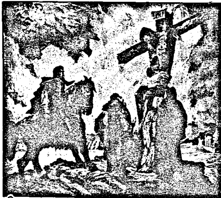
БЕЛИКАТА ЖЕРТВА НА БОГОЧОВЪКА