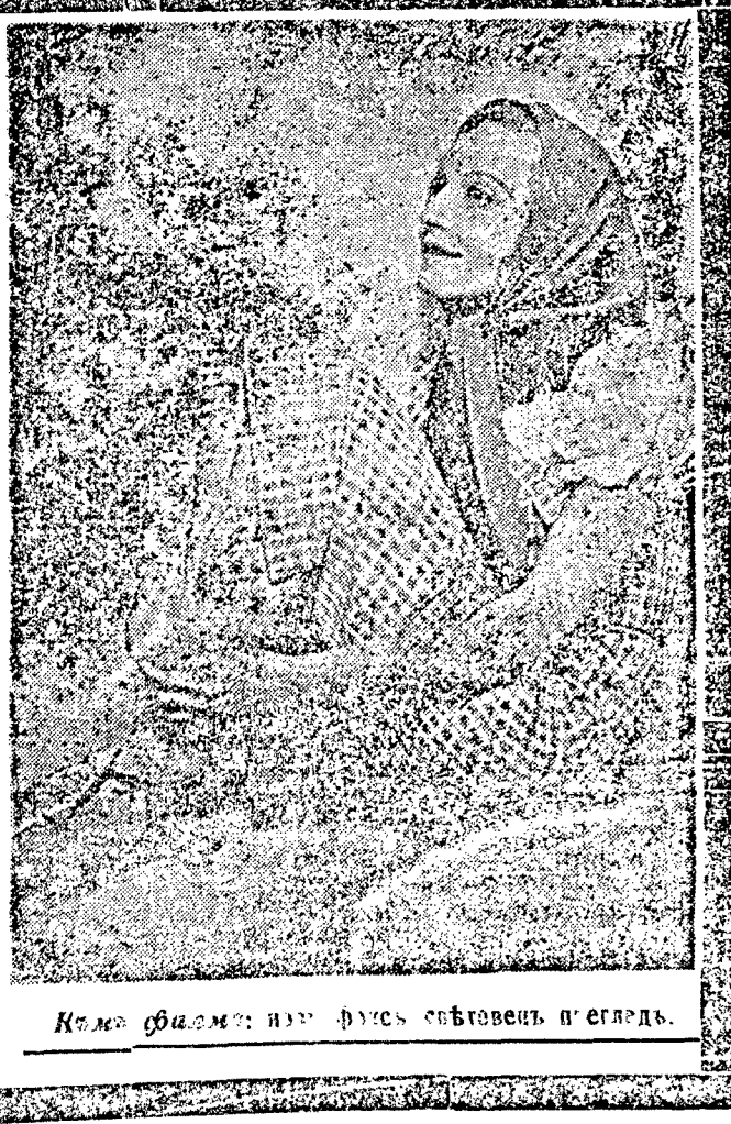
Къмъ филмъ: нов филмъ съответно прегледъ.

Ще се смѣете и ще алцете заедно съ героинята която живѣе на екрана средъ васъ. СЪНДЕЙ ТАЙМСЪ