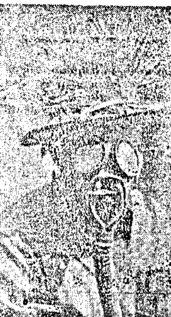
Тѣй изглежда единъ американски пехотинецъ, когато е въоръженъ срещу газово нападение.