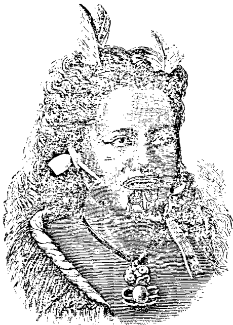
Жена Маорийка, Нова Зеландия.

Въ Южний Тихий Океанъ, почти на половината пжтъ между мисоветъ Добра На-