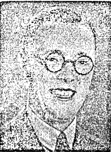
Парижъ, 19 (Хавесъ). Холандскиятъ князь Бернхардъ пристигна въ Парижъ.

чътъ около Шилка е стесненъ, но като че ли нападениетъ бѣха решенъ да не бичтъ въ вратата. Скоро Шилка разкъсва обръче и играта се пренесе въ полето на Владиславъ.