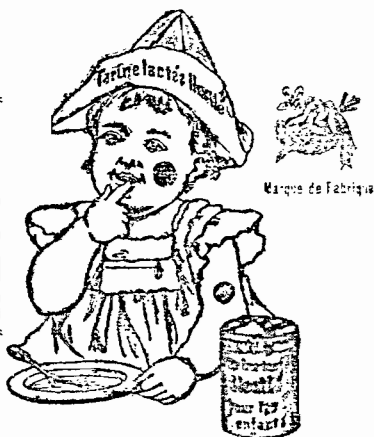
ХРАНА ЗА ДѢЦА

состояща отъ най-доброкачествено швейцарско мляко. Намира се за продажъ въ всичкигѣ аптеки и дрогерии.