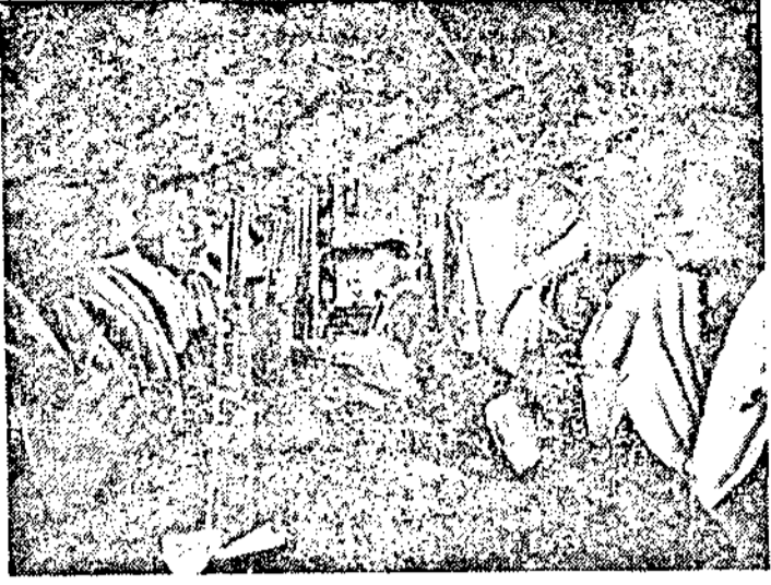
Германски парашутисти очакватъ заповѣдъ за скачане на неприятелскитѣ позиции на източния фронтъ.