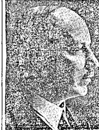
Г. Рити Съюзниците обаче чакатъ своя частъ за започването на една гигантска офанзива срещу германскитъ линии на западния фронтъ. Сигнала за започването на тая офанзива ще бъде даденъ много наскоро.

Следъ като се снрра на преговоритъ които се водятъ между СССР и Финландия, „Ексселсморъ" пише, че Финландското върховно командуване не взема участие въ тия преговори и, че то не е дало съгласието си за тѣхното започване.