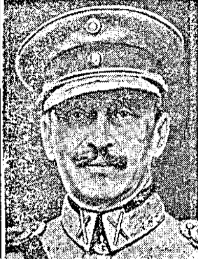
Маршалъ Манерхаймъ Парижъ, 10 мартъ В. „Ексселсморъ" пише въ днешния си брой между другото: Отъ запъването на войната въ Европа, до сега не се е дошло дозначителни военни действия.

Финландското върховно командуване противъ преговоритъ съ Съв. Русия. Съюзниците ще започнатъ въ скоро време офанзива на западния фронтъ