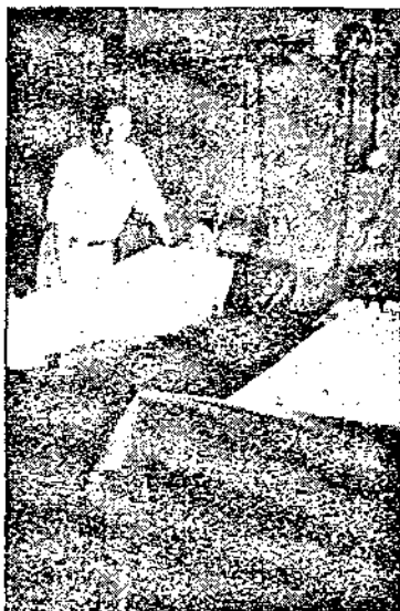
Единъ боленъ въ сухо овиване.

Двѣ снимки изъ водолѣчебния университетски институтъ въ Берлинъ направени въ време на моята специализация.