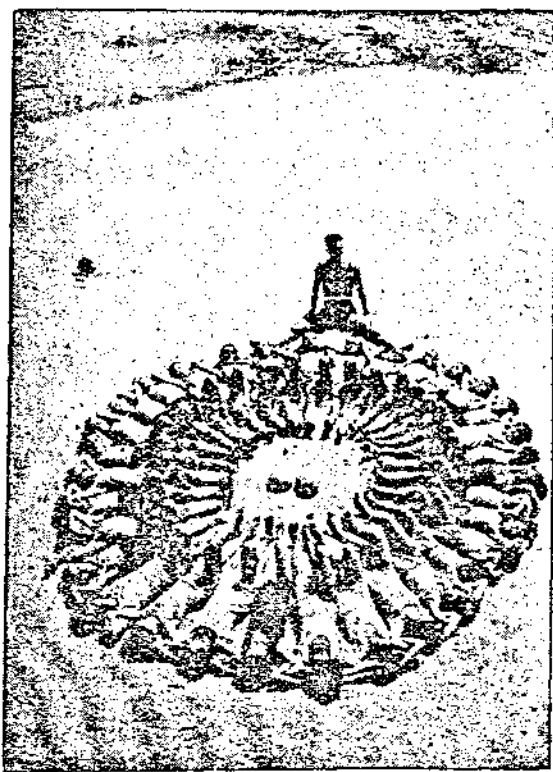
На плажа въ Варна

Б Р. Ето драги читателю, каква стойностъ има писането на рецептитѣ. Ясно наль? Неволно се натрапва тогава въпрска, дали тъй лесно би се решилъ човѣкъ да се откаже по научни съображения да пише рецепти? Наистина твърде тежка задача Ако нѣкой познава нѣкого, който поради интереса на болнитѣ и любовъ къмъ науката би се отказалъ отъ половината си месечни печалби, моля да се съобщи въ редакцията. Това ще е наистина единъ раритетъ.