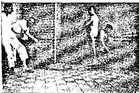
Двама болни на парната струя и една дървена вана за четкови бани.