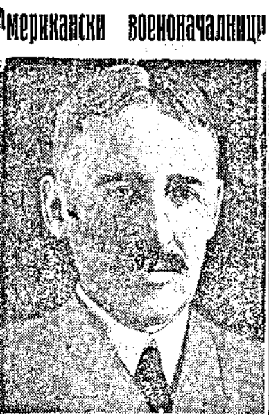
Ген. Хенри Л. Стимсънъ новиятъ министъръ на народната отбрана въ Съедин. Щати.

Полъ панамериканската конференция въ Хавана Ню-Йоркъ, 14. „Нашъналь бродкастингъ къмпани“ съобщава, че американската делегация, която ще участвува въ панамериканската конференция въ Хавана (Куба), се състои отъ 9 члена, начело съ държавния секретаръ на вън. работи Корделъ Хълъ. Въсвещенитъ делегати отъ Вашингтонъ, тязи делегати ще бъдатъ най-виднитъ представители на политическия и стопански животъ на С. Щати. И останалитъ американски държави ще изпратятъ най-виднитъ си представители.