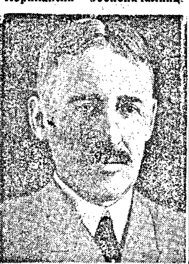
Ген. Хенри Л. Стимсънъ новиятъ министъръ на народната отбрана въ Съедин. Щати.