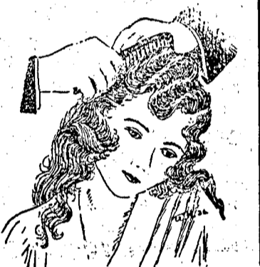
Електрическо дълготрайно (6 месечно) кдрене на дамски и мъжски коси.

Връснаро-фризьорски салонъ „СЕВИЛЛЯ“ на Атанасъ Ивановъ ул. „Царъ Борисъ“ № 6 до кафе „Лондонъ“