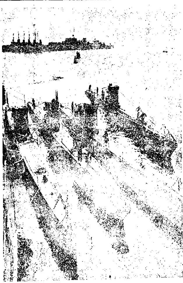
Германски подводници „Ведигенъ“ въ Килското пристанище

кче нѣкое положение което принуждава германското правителство, по негова оценка, да прибѣгне до това право — тѣй наречената „безопасна клауза“ — Райхътъ получи разрешение да увеличи пропорцията до равенството при условие, че предварителни приятелски преговори ще бждатъ