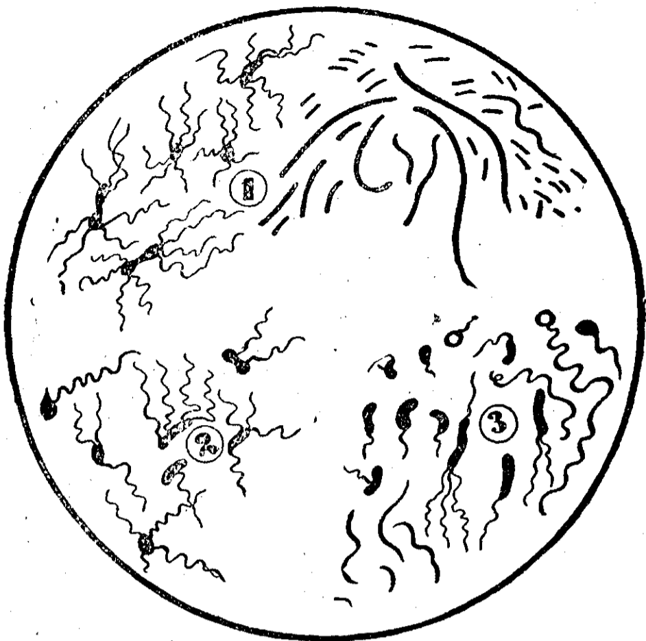
1. Бацила на тифузната треска. 2) Количния бацилъ. 3) Микроба на холерата.