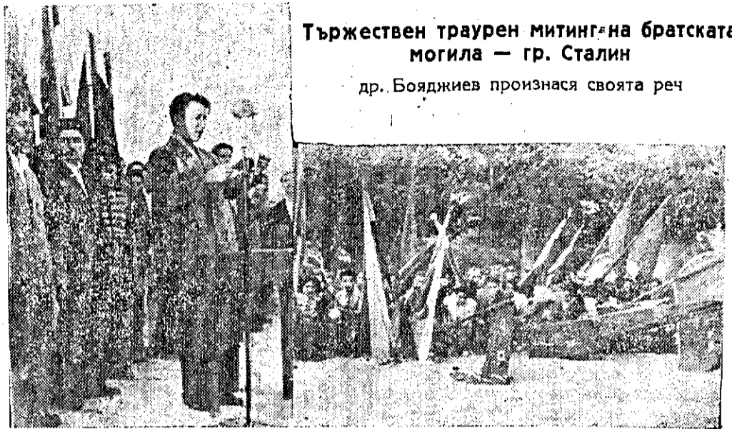
Тържествен траурен митинг на братската могила — гр. Сталин