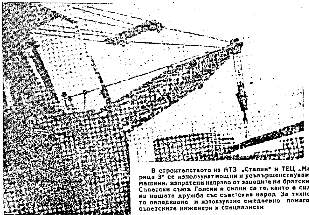
В строителството на АТЗ „Сталин“ и ТЕЦ „Марица 3“ се използват мощни и усъвършенствувани машини, изпратени направо от заводите на братския Съветски съюз. Големи и силни са те, както е силна нашата дружба със съветския народ. За тяхното овладяване и използване ежедневно помагат съветските инженери и специалисти