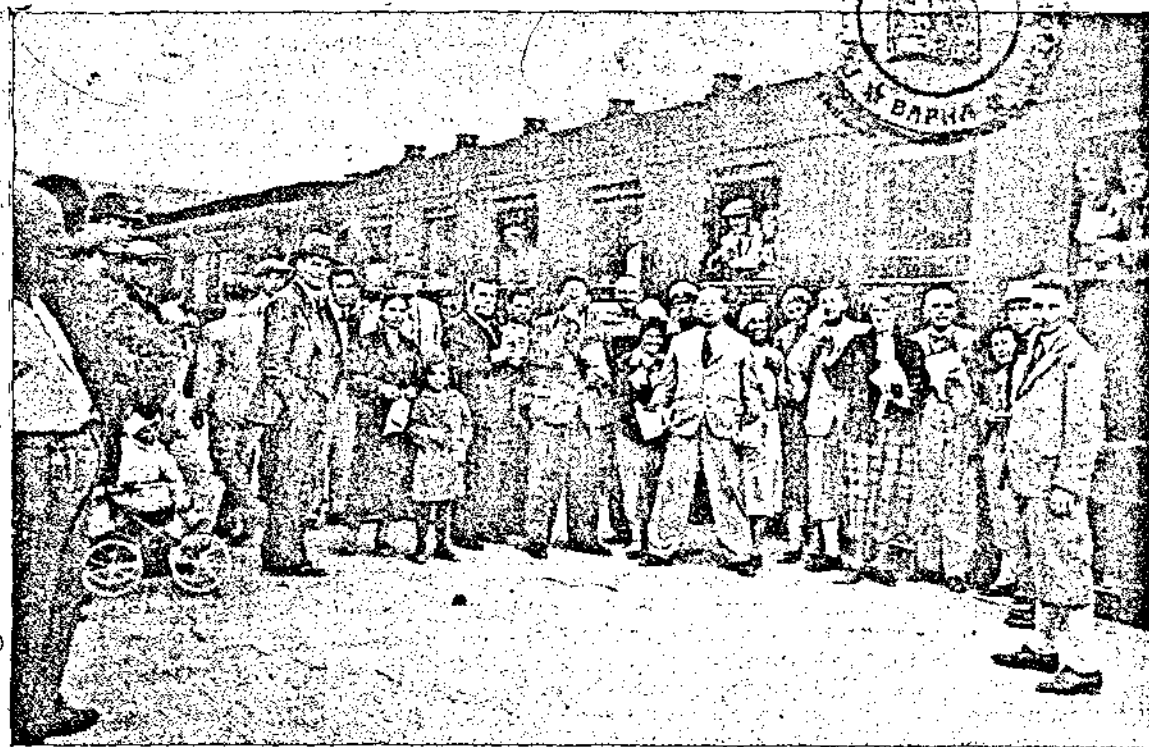
Раздаване грозде на отпътуващитъ лѣтовници преди тръгване влака отъ Варна.