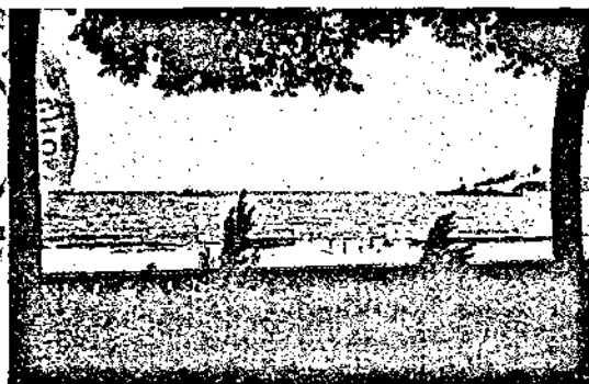
Турския броненосец „Явузъ“ и двата контра-торпильора в Варненския заливъ, дошли да отнесатъ турските гости в отечеството имъ.

Le croiseur turque „Yavouz“ et les deux contre-torpilleurs dans le golfe de Varna venus pour emporter les hôtes turcs dans leur patrie.