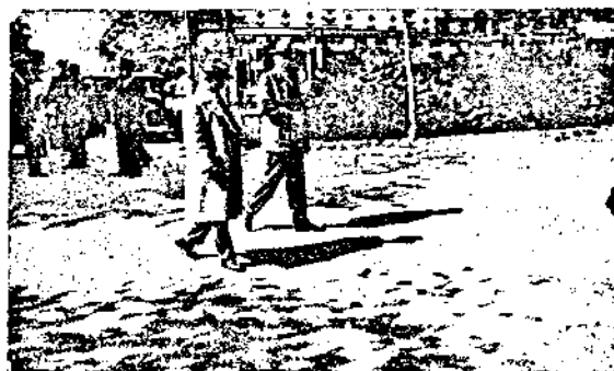
Турския и нашия Министър-председатели при влизането им в морската градина на път за казиното.