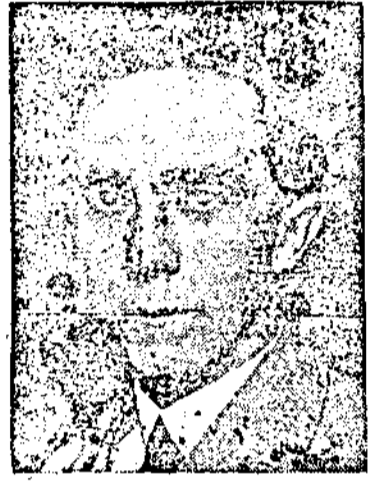
г. д-ръ Гьобелс

Катовиц, 1. М-рът на Райха д-ръ Гьобелс днес след пладне говори в Катовиц на едно събрание по случай годишната отъ освобождаването на източна горна Силезия. След като обрисова положението на тази област след 1918 год. и събитията които предхождаха настъпването на германските войски в Полша, д-ръ Гьобелс заяви, че Германия има най-смелата и най-добре екипирана войска и, че тя е станала толкова неуязвима и гарантирана, че надеждата на Англия сж напразна.