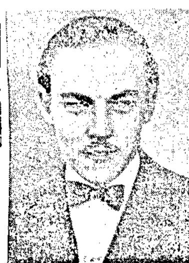
Париж, 1. (Ройтеръ) Министрътъ на външните работи, маркизъ Петенъ, днешенъ министъръ на монархията, каза прицетъ блже възкачелъ на трона.

Париж, 1. (Ройтеръ) Министрътъ на външните работи, маркизъ Петенъ, днешенъ министъръ на монархията, каза прицетъ блже възкачелъ на трона. Париж, 1. (Ройтеръ) Министрътъ на външните работи, маркизъ Петенъ, днешенъ министъръ на монархията, каза прицетъ блже възкачелъ на трона.