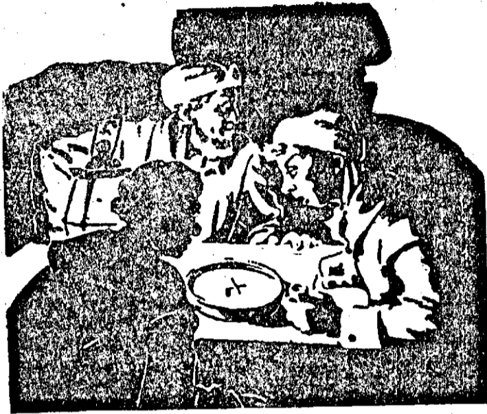
Капитаните с затаен дъх следяли, как се завърта иглата

„Ц. Д. К. А.“ победи „Динамо“ (Москва) с 5:0 и е футболният първенец на Съветския Съюз за 1947 год. Интересно е да се отбележи, че при една победа с по-малък резултат, първенецът щеше да бъде „Динамо“, понеже броя на точките и на двата тима е еднакъв и единствената възможност на „Ц. Д. К. А.“ да стане първенец е била да спечели с 5:0 или с 9:1.