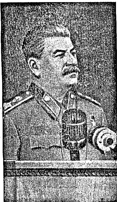
(СТАЛИН — в писмото си до моряците от кораба „ЧЕРВЕНА УКРАИНА“)

„Приятно е да се работи с такива другари. Приятно е да се бориш с враговете в редиците на такива бойци. С такива другари може да бъде победен света на експлоататорите и угнетителите“.