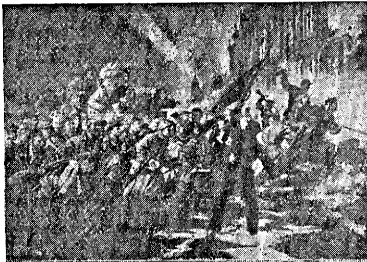
Моряци и работници штурмуват Зимния дворец

Ето така през Октомври, застава на от двете страни на барикадата масите на революционното морячество и отделни [групи] от настроени против народа офицери. Победата беше спечелена от щабовете; на трудовия народ.