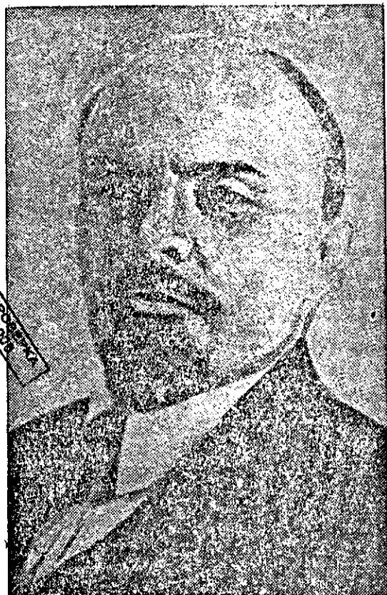
„В флота ние виждаме блестящ образец за творческите възможности на трудящите се маси. В това отношение флота се прояви като член отряд на революцията“.